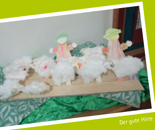
Der gute Hirte