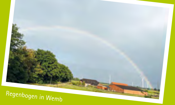
Regenbogen in Wemb