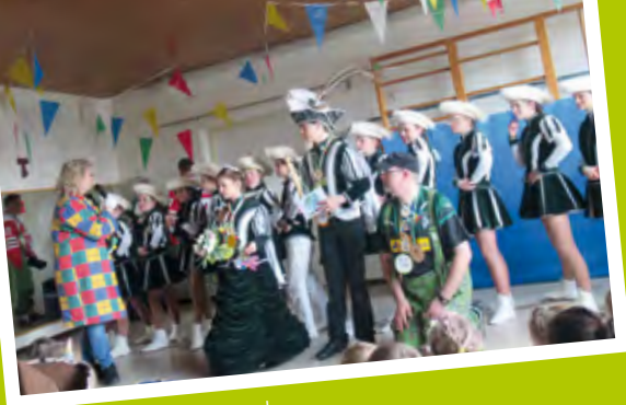
Das Prinzenpaar zu Besuch