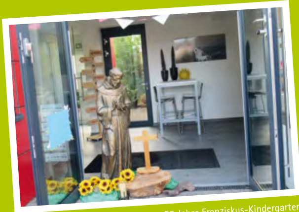
55 Jahre Franziskus-Kindergarten