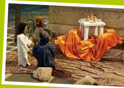
Das letzte Abendmahl