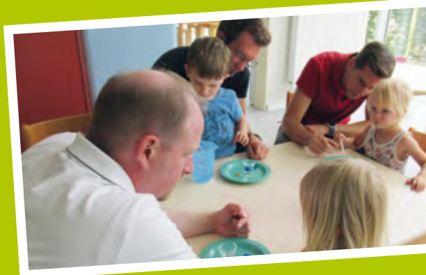
Experimente für Vater und Kind