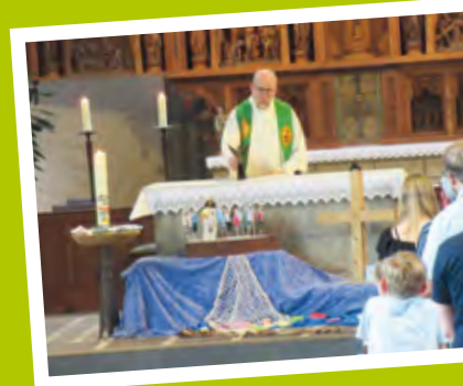
Abschiedsgottesdienst der Vorschulkinder