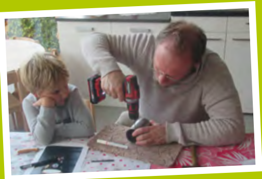
Kreatives für Vater und Kind