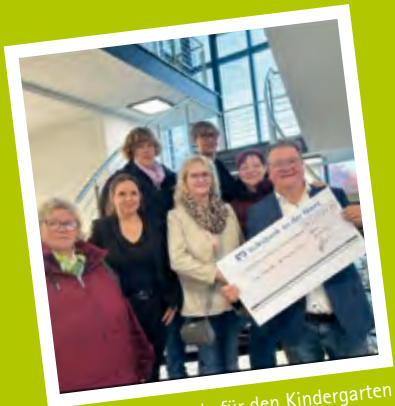
Spende für den Kindergarten